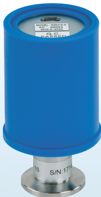
SWU10-U (NW16 仕様)

お客様がお持ちのスマートフォンで手軽に真空計測が可能です。専用の電源やディスプレイは必要ありません。