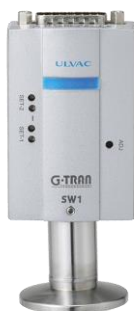
SW1 + ISG1